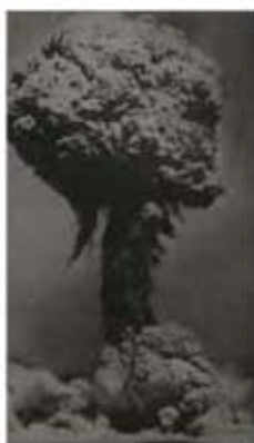
ACIULAK PERIS, J. et al.: Física. COU. Plan de 1970. Madrid: Anaya, 1970, p. 429.

Durante el siglo transcurrido, la investigación básica atómica junto al desarrollo de la energía nuclear, con fines pacíficos o militares, suscitó el interés de una sociedad que observaba la llegada de unos nuevos conocimientos, sin precedentes hasta el momento, que parecían aportar un