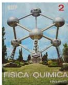
BASCONES PEÑA, P. et al.: Física y Química. 2º BUP. Plan de 1970. Zaragoza: Edelvives, 1989.

Los manuales escolares españoles de Física y Química fueron unos importantes agentes de divulgación científica de los descubrimientos científicos mencionados, ayudando a construir, mediante multitud de expresiones e imágenes incluidas en las lecciones atómico-nucleares, representaciones mentales en los jóvenes estudiantes que han conformado un gran imaginario social nuclear