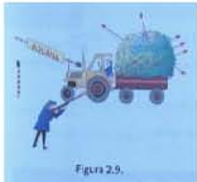
PEÑA, Á. et al.: Física y Química. Ciencias de la Naturaleza. 3º ESO. Madrid: Mc Graw-Hill, 1995, p.43.

“La situación que se les planteó a Thomson y a Rutherford cuando estudiaban la constitución del átomo es similar a la preocupación de un policía de aduanas que sospecha que se está traficando con objetos metálicos introducidos en un cargamento de heno”.