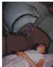
AINSA, J. V.; RUBIO, L. M.: Física y Química. 2º FPI. Madrid: Santillana, 1990, p. 109.

“Las bombas de cobalto constituyen una aplicación de la emisión radiactiva”.