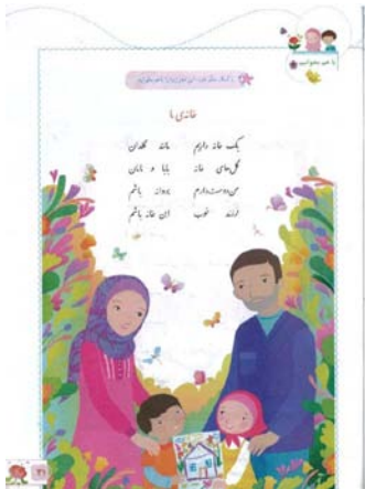
Manual de Irán . Libro de lectura en lengua persa. Teherán, 2006.