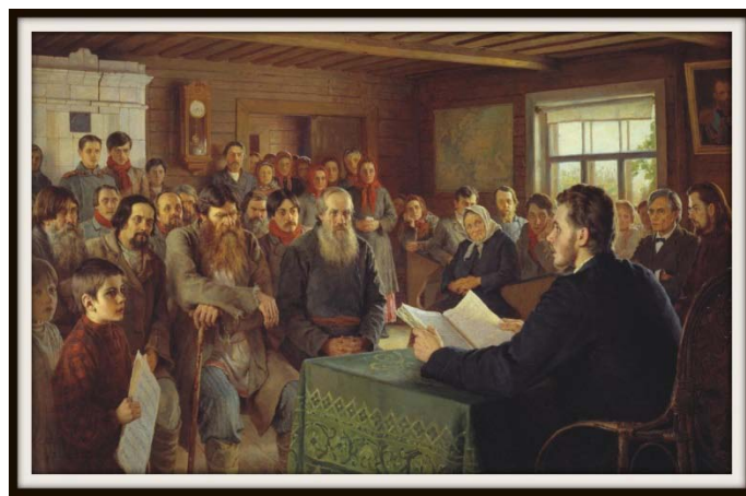
Nikolay Petrovich Bogdanov-Belsky (1868-1945), Sunday Reading at Country School , 1895. Museo Estatal Ruso, San Petersburgo.

Otro de los propósitos es mostrar el proceso de creación del sujeto lector, desde su temprana y frágil configuración durante la Edad Moderna, en buena medida condicionado por la estrecha vinculación entre alfabetización y formación cristiana, al menos en Europa, hasta la expansión de la lectura al pueblo y el salto de la lectura instrumental a la lectura comprensiva, crítica y sobre nuevos soportes.