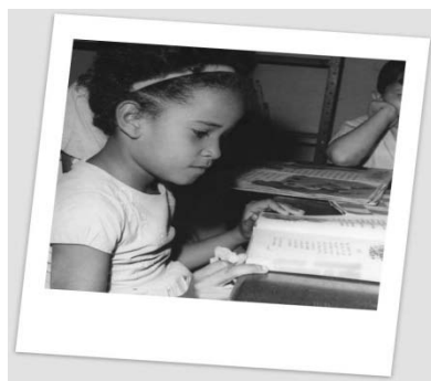
Campana de alfabetización, Cuba 1961.