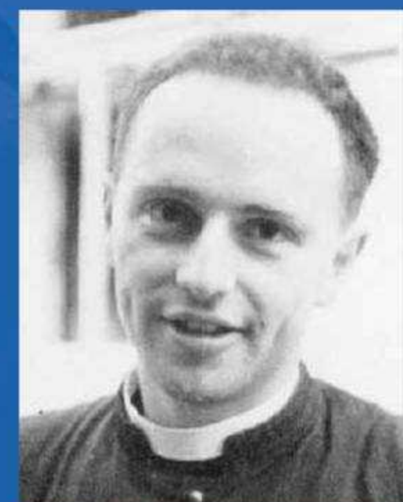
Imagen y pensamiento crítico: