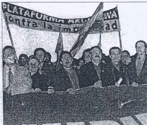
Carod-Rovira, vicepresidente de la Generalitat, en el capítulo sobre soberanía nacional del libro de Geografía e Historia de 2º de ESO de la editorial La Galera.

El libro de Historia de 2º de Bachillerato de Edebé señala que «Cataluña ha sido históricamente una nación europeísta» y mencio-