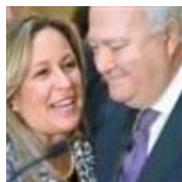
Las lágrimas de despedida de Moratinos