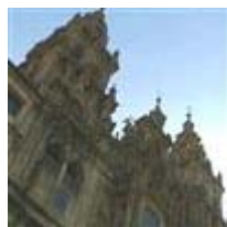
Santiago de Compostela, a 15 días de la visita del Papa