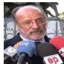
Los insultos del alcalde de Valladolid y sus disculpas