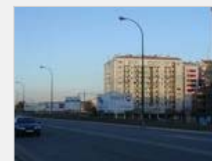
Carteles o jardines