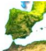
El Tiempo en España