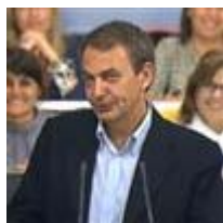
Zapatero: "Viendo las caras del PP, hemos acertado"