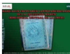
_□1-Cartel - 2