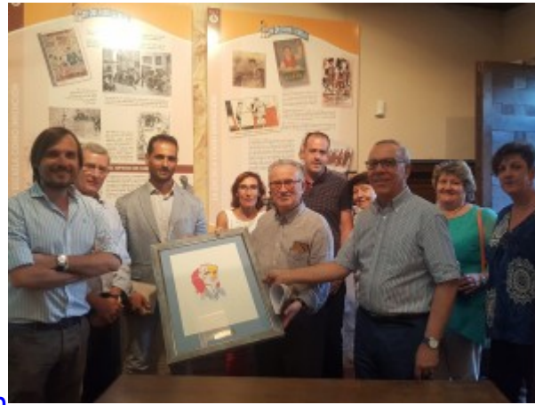
Acta de resolución